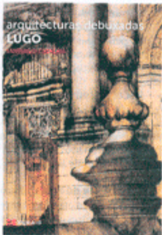
El libro. La cuidada edición de «Arquitecturas debuxadas» realiza la visión de Catalán de los edificios que más le llaman la atención. A. LÓPEZ

bujos que conforman este libro hay arte, pero hay también documentación sobre los inmuebles elegidos por Catalán; por eso es